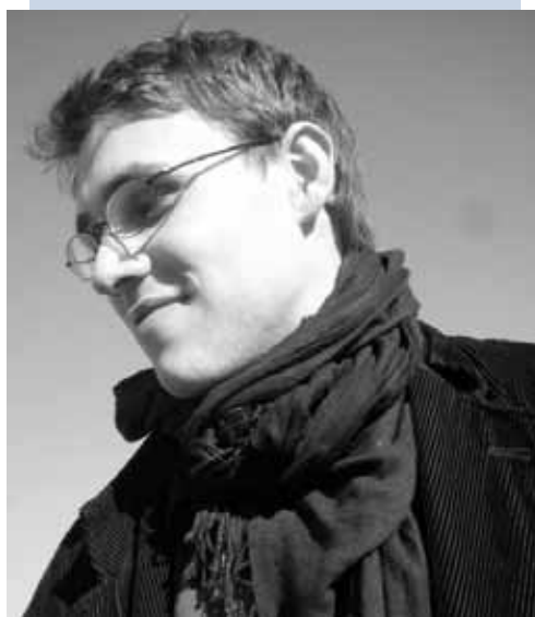
ist Vorsitzender des Bezirksverbandes Stormarn Süd und studiert Politikwissenschaften

her zum „nächsten Kanzler“ gewählt wird? Dass jeder von uns Bundeskanzler bzw. Kanzlerin werden kann. Dass jeder in diesem Land etwas verändern kann. Und der daraus auch abgeleiteten Verantwortung, dass jede und jeder, wenn er/sie etwas verändern kann, auch dafür mitverantwortlich ist, was aus diesem Land wird. Diese Botschaft ist das Kernstück jeder Demokratie. Nur dann kann es eine lebendige Gesellschaft geben, in der sich nicht jeder um sich selbst kümmert, sondern man zusammen anpackt.